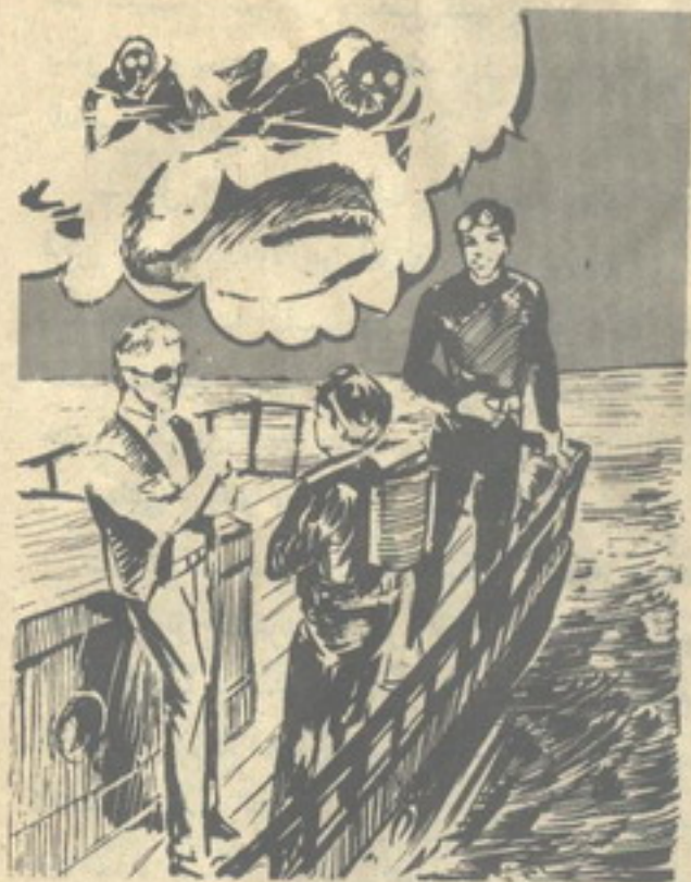
علت ابتسامه على شفتى الرجل الطويل ، الذى ارتكن إلى حاجز الزورق بلا مبالاة ..

أشار إليه ( مصطفى ) بسبابته وهو يقول بحدة :